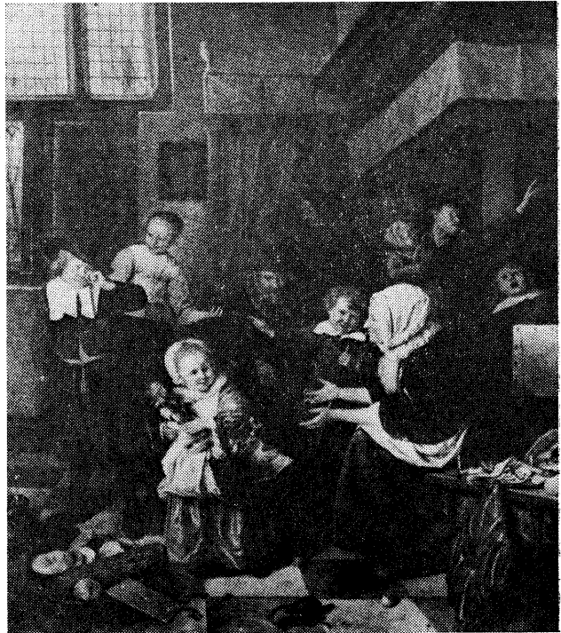
図9・ステーン 聖ニコラス祭