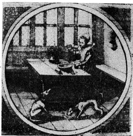
図4・「与えられたものを喜んで受けよ」