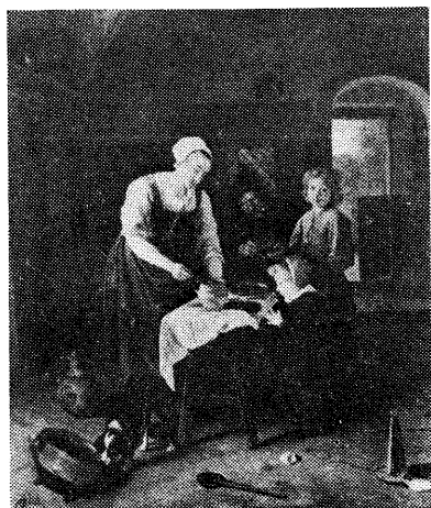
図6・ステーン 「食事時の農民一家」