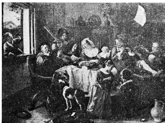
図7・ステーン 「愉快な仲間」 (老人が歌えば若者が笛吹く)

の給仕を少女が小さな手を合わせて待っている。が、祈りは形だけで、心は目の前の皿に配られる食物にのみ向いている。後の兄も祈るというよりは、単に準備を待っているという風情である。親たちも一時、手を休めるところとさえしない。床は散らかり、飼犬が鍋の縁を嘗めている。