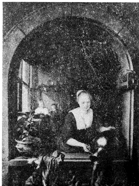
図5・ダウ「窓辺の女中」

し、子は口を開け待っている。(図3)は子供が嫌がって泣いたり顔をそむけたりしている例も見られる。これらはいずれも「粥を差し出されたら口を大きく開けよ、さもないと後で何ももらえない」という諺によっている。つまり、粥も有難く受けければ、後でもっとよい御馳走が与えられよう、という訳である。当時のクラメリの寓意書では、神の恩寵もこの諺のとおりと記述され、子