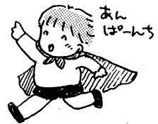
ふろしきマントのアバンマン 何だか昔なつかしいぞ。

こんな優しいひとときがあると、つわりのことも忘れて、妊娠っていいなと思ってしまう。