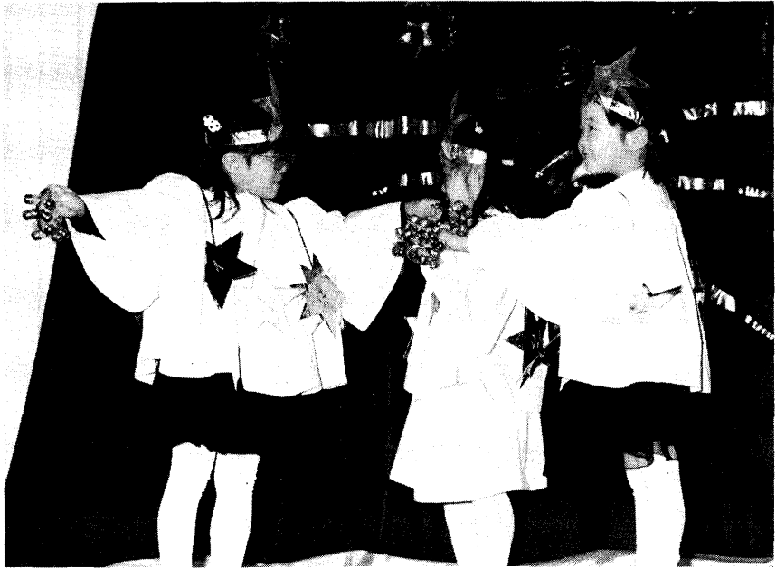
▲遊びの中の鳥が飛ぶ表現を幼児が星の子に取り入れました