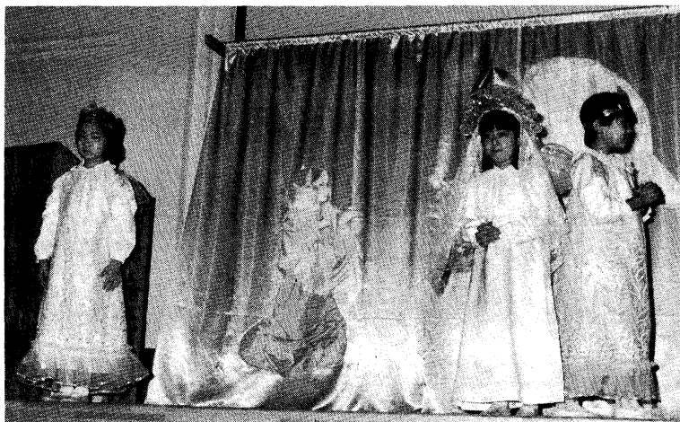
▲教会学校でのお祈りの場面を幼児がとり入れました