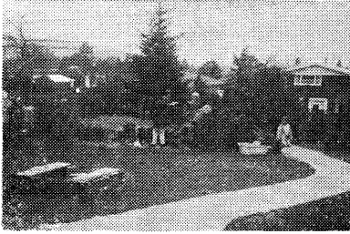
▼写真2 庭で木工をする子ども