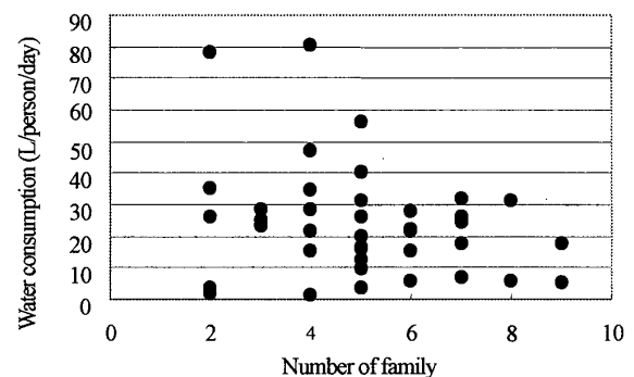
Fig.3 The correlation between water consumption of Cloth washing and Number of family

一例として、乾季の Urban area の cloth washing と世帯人数との散布図を Fig. 3 に示す。相関係数 R^2=0.0324 と相関はみられなかった。同様の手順で各用途において、1人あたりの1日平均使用量と世帯人数・世帯における5歳以上の人数・日中在宅している人数・世帯の1ヶ月の収入・1人当たりの1ヶ月の収入において散布図を描き、相関係数を求めてみたが、いずれにおいても相関はみられず、生活形態、生活レベルは決定因子としては弱いことがわかった。