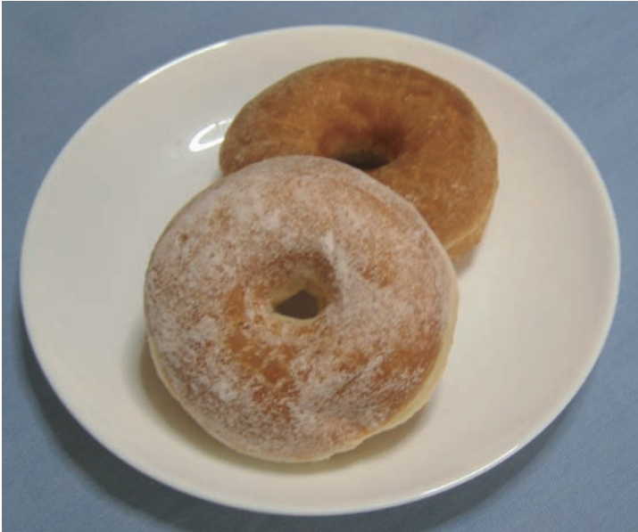
図4.1 ケーキドーナツ（オールドファッション）（上）とイーストドーナツ（下） ケーキドーナツには亀裂があり、イーストドーナツには亀裂がない。