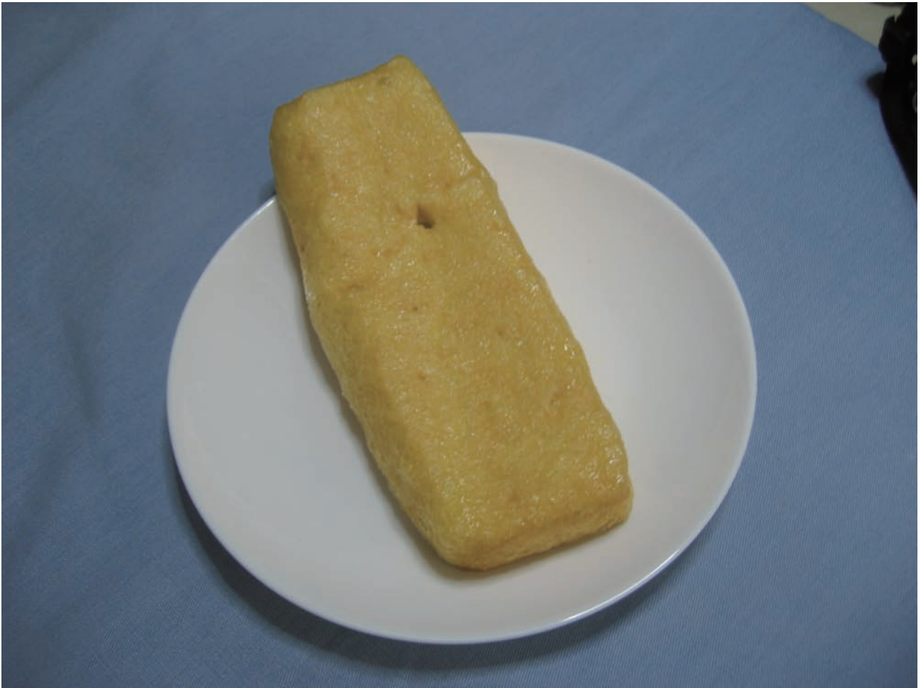
図4.5 栴尾あげ 上方に穴が開いている