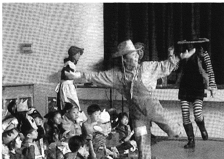
▲先生はかかしだよ !!

街の中も、それぞれの家庭の玄関にはジャックオーランタンを置き、庭やテラスに、お化けや吸血鬼