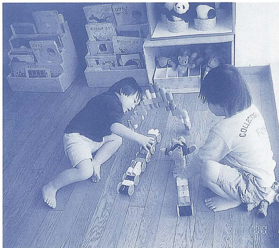
遊びに興ずる子どもたち（ききょう保育園）

親による子ども虐待の横行する時代に 親が子育ての責任を果たすためには、保育者はどんなサポートができるか、 共に考え提案しています。 少子化がますます進む時代に 子どもと接する経験が不十分のまま、保育の仕事に就こうとする保育者が多い 今、子どもに何をみて、どうかかわればよいかを、分かりやすく説いています。 子どもを取り巻く環境の変化が著しい時代に 幼稚園・保育園のいずれも、今までは異なる保育の課題が求められています。 21世紀の保育の在り方と課題について、具体的に提案しています。 最新の資料と研究成果に基づいて 子どもの幸せを願い、子どもと共に歩む大人すべてに、保育の喜びと生きがい を感じられる保育の原理を示しています。