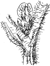
ダイズ(エダマメ)の花

収穫したエダマメは、好評のうち食べ尽くした。ところが、後まきしたものは、莢の中の豆は茶変、萎縮していて、まったく食用にならなかった。開花期に発生した虫の食害を受けてしまったのだった。