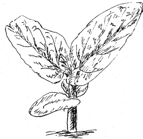
ダイズ（エダマメ）の芽生え

梅が実をつけ、サクラが散り、気温も上がるツツジの開花を迎えると、畑の人影が、一段と濃密になる。