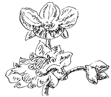
オオイヌノフグリ

に葉を茂らす。フキが葉を大きく掀げる。ネギが坊主をつけた。その株元を守るように、ナズナが花を開き、スズメノカタビラが、穂をつけている。