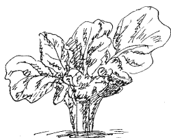
ジャガイモの芽生え