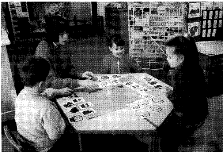
▲先生とゲームをしながら数の勉強。無理にやらせる事はないが、ゲームのやり方は前以ってはっきりと決まっています。幼児はそれを守らなければならない。

「さて、その日、先生のクラス全体への言葉かけは、九時二十分に出勤をとる事から始まった。九時に登園