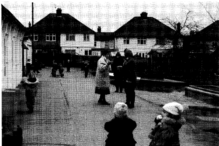
▲自由な遊びの時間。先生たちはお茶を楽しみながら子どもたちの遊びを見守っている。