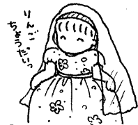
最近こってる「おひめさまごっこ」保育園のドレスはとりあいです。

つ落とし穴がある。ある日、布おむつの中に一枚、紙おむつをいれて洗ってしまったのです。洗いはがりは悲惨！ 布おむつ一枚一枚に、びっしりついた高分子吸収体のツブツブ。はたいても振っても落ちない。水で流せば流しがつまる。庭中、雪のようにツブツブが舞う… きゃー。