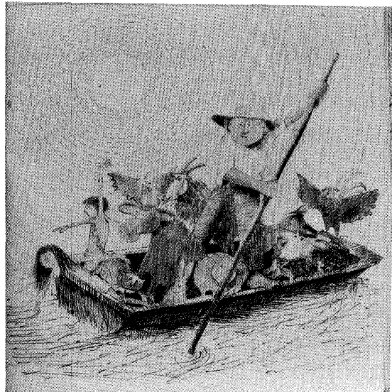
▶ 図版3 『ガンピーさんのふなあそび』より

ユング派の分析心理学者、河合隼雄が『こころの天気図』の中で、『あしながおじさん』を例に挙げて、男性の中にも母性的な側面のあることについて論じていますが、このガンピーさんにも豊かな母性を感じられます。