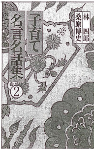
子育て名言名話集②