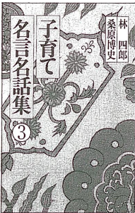
子育て名言名話集③