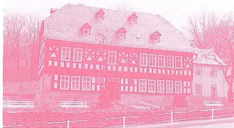
フレーベル先生の生家

幼児教育の父といわれるフリードリッヒ・フレーベル先生がその活動の場とした、東ドイツ・チューリンゲン地方を訪ね、使用した各々の教育玩具や資料などを見学し、幼児教育のルーツをたどってみませんか。