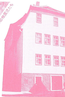
フレーベル博物館