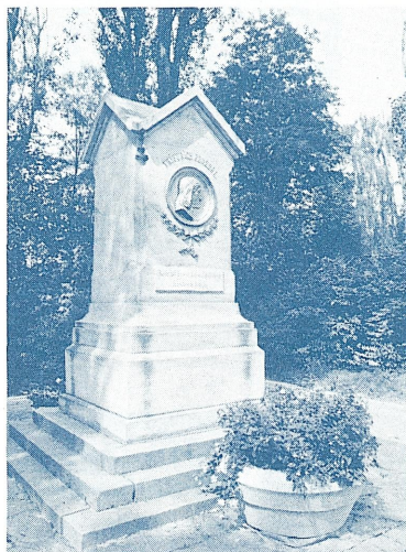
↑ 森林公園内にあるフレーベル記念碑 (パートブランケンブルク)