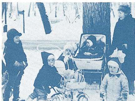
◀ フィンランドの“公園おばさん”と幼児たち (ヘルシンキ郊外)

ことしはフレーベル先生の生誕 200 年記念の年です。よそおも新たにたつた遺跡をゆつたりとした日程で巡ります。さらに今回はじめてフィンランド、ノルウェー、デンマークと北欧の幼児教育施設を中心に視察し、アンデルセンのふるさとオーデンセを最終訪問地として計画いたしました。幼児教育の祖とメルヘンと白夜がいざなう旅へご案内いたします。みなさまのご参加をお待ち申し上げます。