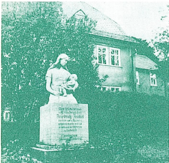
母と幼な子の像とフレーベル先生の生家