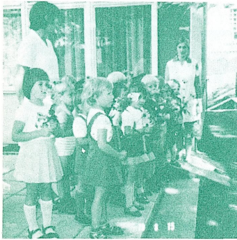
花束で迎えてくれる園児たち