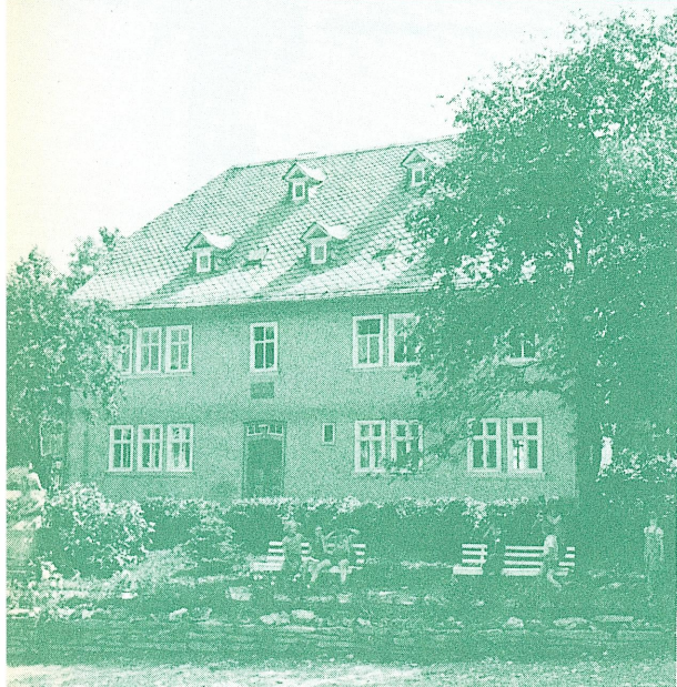
フレーベル先生 生家

幼児教育のルーツを求めて、従来は入国のむずかしかった東ドイツを中心としたヨーロッパ視察の旅に出してみませんか。幼児教育の祖、フレーベル先生の遺跡をたどりながらヨーロッパの自然にふれ、メルヘンのさとに遊ぶ旅にお誘いいたします。