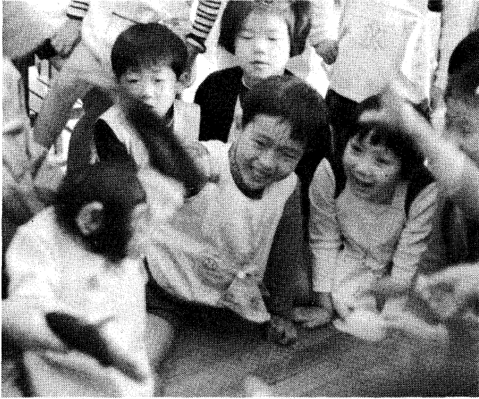
サッチャン、遊ぼうよ