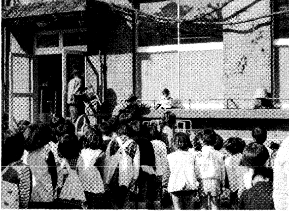
サッチャン、おはようございます。