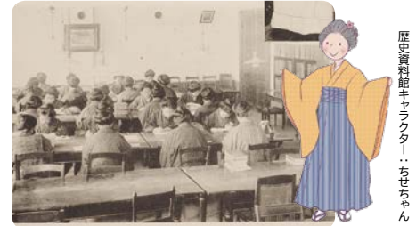
女高師の図書室大正8年(1919)