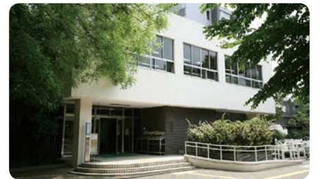
現在の附属図書館