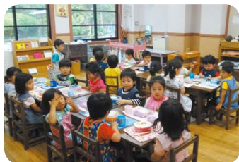
はじめてのお弁当