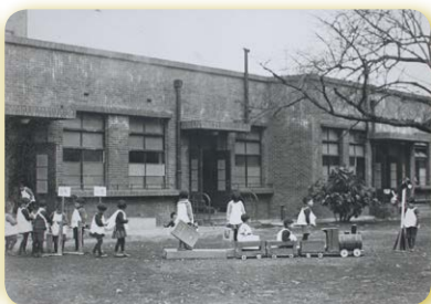
昔の園庭での遊び

ンチでした。その廊下の照明が、今回の工事で大変工夫され、梁の後ろに設置されるようになり、玄関から見ると照明が見えなくなっています。照明の色も電球色で、温かい雰囲気になりました。その照明の効果で、高い天井がより高く、そして長い廊下がより長く感じられるようになりました。