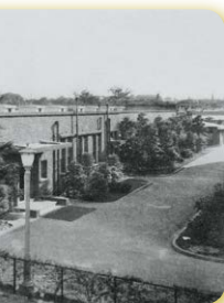
大塚に移転当時の園舎