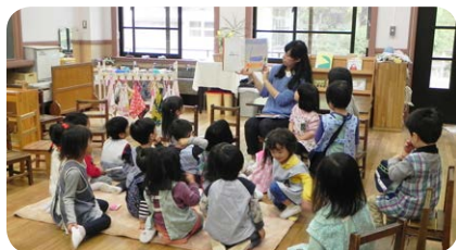
3歳児お帰りの集まり(4月)

幼稚園の園舎の中には、玄関から真直ぐ長く続く廊下がありません。測ってみたところ幅は2メートル66センチ、長さは51メートル72セ