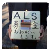
上野公園での募金活動