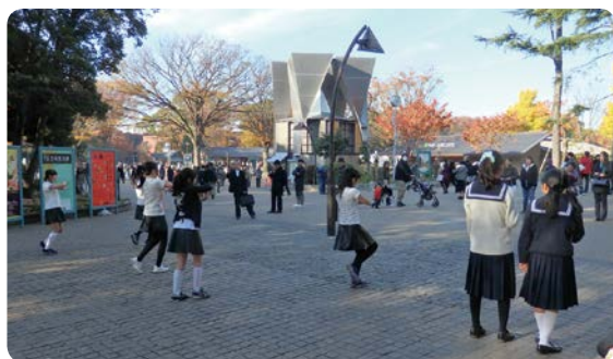
上野公園でのパフォーマンス