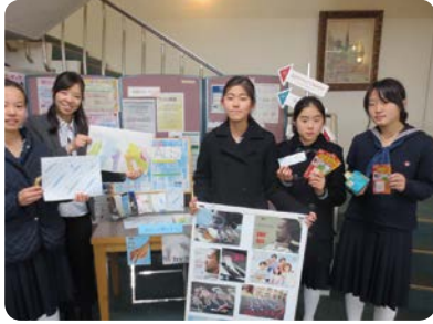
大学図書館に紹介コーナー設置