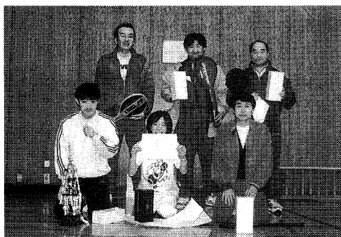
優勝 会計課チーム