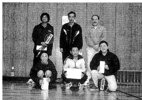
準優勝 学生部チーム