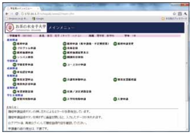
■メインメニュー画面