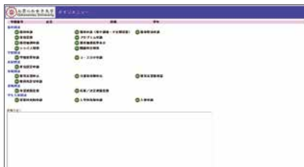
■メインメニュー画面