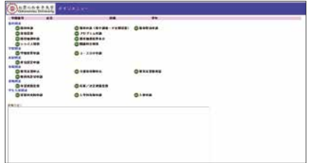
■メインメニュー画面