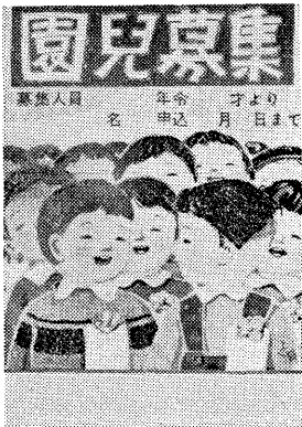
園児募集ポスター