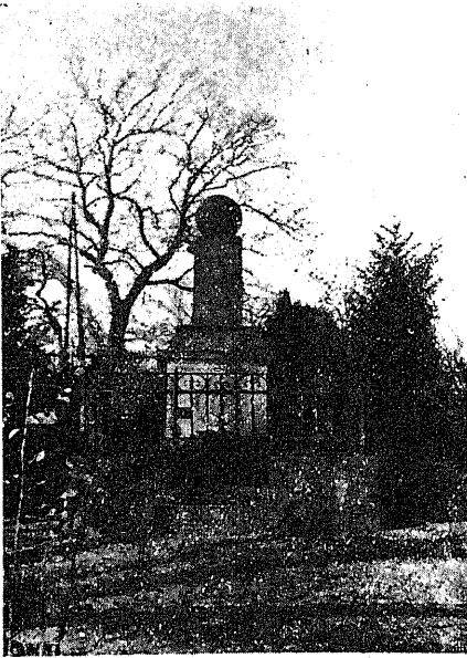
(ナイワユシ)墓の生先ルペーレフ

歳の天壽を全うして、先生は此の家の二階南向の角部屋で、平和なる永遠の眠りに就かれました。