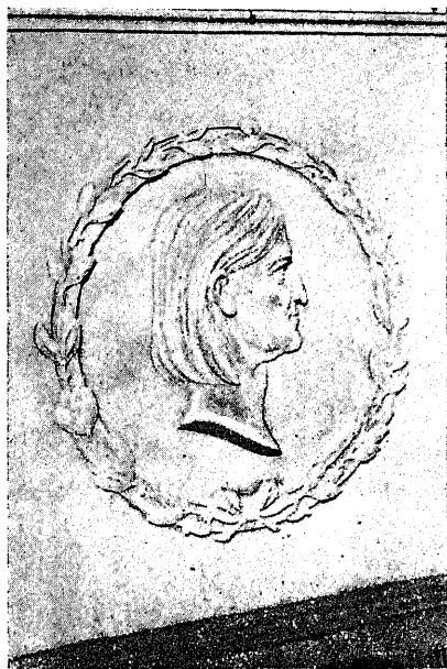
墓碑銘のルーデル先生の横顔

この墓地から一步轉じて、遙か十數町の彼方、マリエントールの小高い丘の茂りをバックミして、古い一つの碑の如きものが淋しく立つてゐるのを發見しました。同じく球ミ圓筒ミ立方體の恩物型です。„Kommt, lasst uns unsern Kindern leben.“「來れ、子等ミ共に生きん