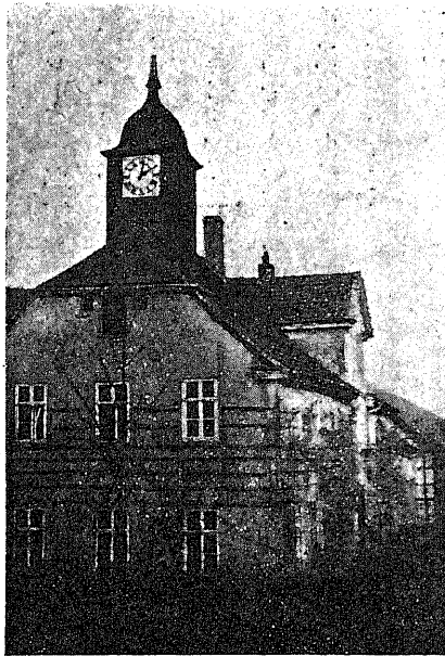
(ウハルイカ)臺計時のルベールフ

翌朝——十一月十一日——ニッカー・ボッカーに輕装してプランケンアルヒを立ち、朝霧を衝いて、單身山越三里の道を、徒歩でカイルハウへさ向ひました。プランはすっかりブリューナーファー博士が立て、下さつたのです。