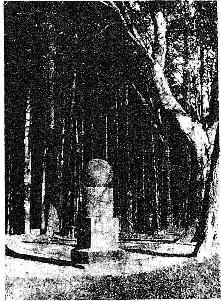
(墓の初最のルベールフ)標碑の物恩

打かけ、そのかみの事、様々思ひ廻らしつゝ時の過ぐるを氣附きませんでした。フト頭を擧ぐれば、赤陽まさに山の端に没せんとし、木枯の音頃に騒がしく、寒さが肌をさす様に感じましたので、急遽リーベンシュタインの宿所へ引揚げました。