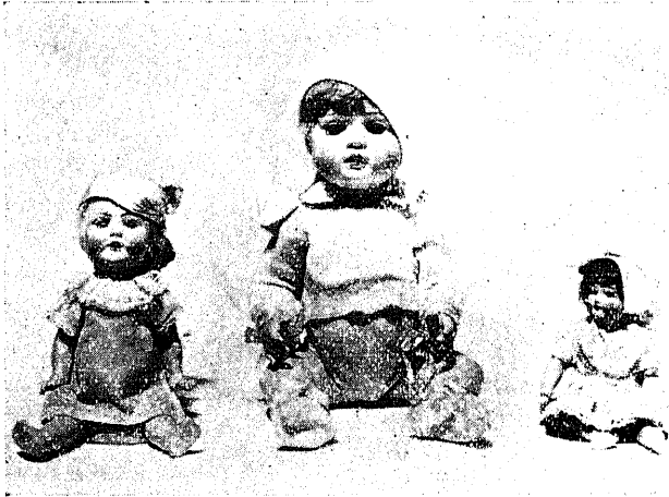
(照參文本) 形人逸獨

みて、それに圍まれた中庭は柔かい一面の芝生、そこに花壇が設けられ、色きりぎりの美しい花が今を盛りに咲きは