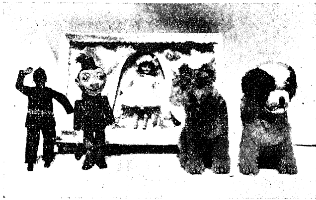
(照參本文) 具玩と形人おの逸獨

このアッバートの一世帯の部室さいふのは三室であつて、それに風呂、便所が附随し、暖房装置も總て行き届き、瓦斯を燃料とする炊事場があり、寢臺三個が備へられてゐて、日常の居住に事缺くことなく完備してゐます。そして大形の窓には一間ほぎの露臺がつけてあり、秋の草花が澤山に咲いてゐました。賃貸料一箇月、邦貨にして約七圓ほぎ。住つてゐる人は主に勤勞階級の人々のやうに見受けられました。