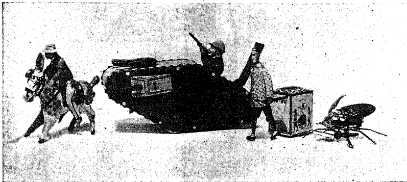
(照參文本) 具玩く動で掛仕ネバ 具玩い白面るす作動は又、し進行々夫にうやの物質、とすまき置てけかなネバ

官で、その善、 美をつくした結 構は礎に東洋の 順禮者をして驚 嘆させるものが あります。 貝の間こいふ のは恰もロビイ (Lobby)の如き ところで、柱も 壁面も、ダイヤ モンド、眞珠、 水晶、サファイ ヤ、ルビー、瑪 瑙、蛇紋石、珊 瑚等、原石のま ま、又は加工せ ざる採取のま