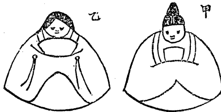
雛 や み (一)

頃から、男子を祝福する端午の節句祭が隆盛に趣くに從ひ、上巳の雛祭もだんく旺盛に行はれることになりました。