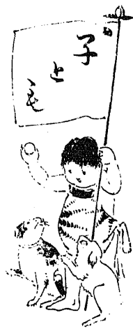
(禁載ては本) (子とを轉凡欄)