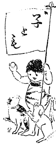
(てはは本 す禁を載轉)