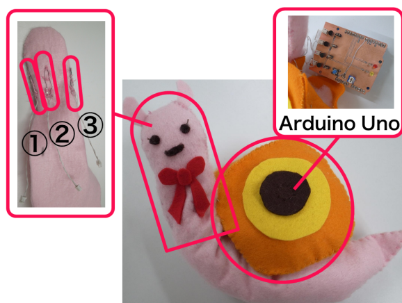
図 2. SmileSnail のプロトタイプ

わいらしさや愛着を感じるぬいぐるみを模した柔らかい質感とデザインを工夫することで、生活の中で違和感なくユーザの感情コントロールを穏やかに支えることを目指した。しかし、動きを制御するマイコンや電池など、どうしても硬質な部分が残ってしまい、手に取った際、さわ心地に違和感が出てしまうことが考えられる。SmileSnail では、硬質な殻と柔軟な胴体部分を持つカタツムリの形を模すことで、硬質な部分と柔軟な部分が混在していても違和感のないデザインを工夫した。