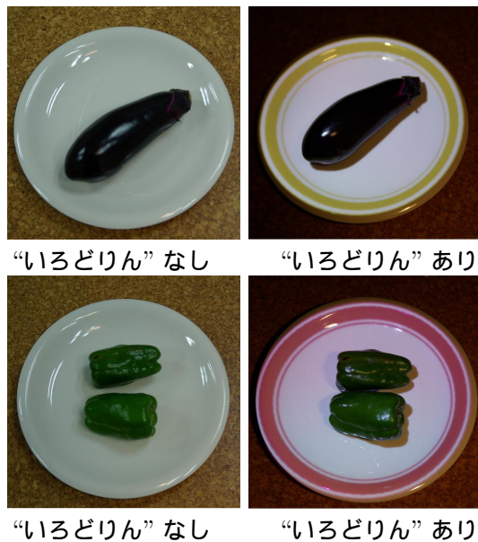
図 3. いろどりんシステムで彩りをあざやかにし，視覚的なおいしさを演出

本システムは C++ 言語を用いて実装し，画像処理には OpenCV ライブラリを用いた．WEB カメラ ( Logitech V-UB2 )，Windows PC (Centrino Duo 1.5GHz, RAM 1.5MB) を使用した．本システムで彩りを加えた例を図 3 に示す．