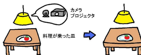
図 1. 「いろどりん」の概念図。システムが彩り色を計算し、自動的に提示する。

提案システム “いろどりん” の概念図を図 1 に示す。電気傘の中にカメラとプロジェクタを一体化し、情報を提示する照明器具 [4] を作製し、これを食卓に設置する。使用する皿は白色とし、プロジェクタからの彩り色投影によって、皿の柄や色合いを変化させる。例えば、図 1 のような皿をシステムに適用すると皿の上には赤が多いので使われている色 (“使用色” と定義する) は赤と判定する。システムは使用色を元に彩り色を計算し、プロジェクタを用いて皿の周縁に彩り色で柄を投影する。