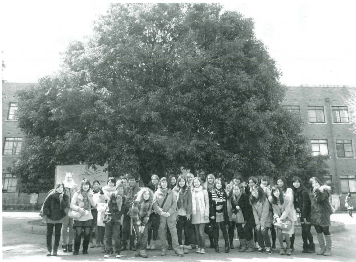
国際ジョイントセミナー研究報告発表者 8大学合同国際学生フォーラム (2014年3月13日)