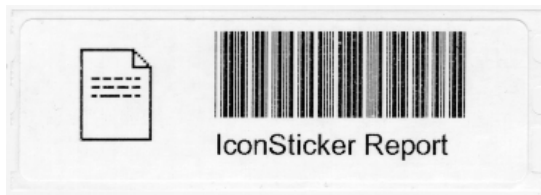
図2. IconStickerの例。アイコンの図柄、名前、バーコードが28 x 89 mm のラベル用紙に印刷される。アイコンの図柄が印刷されるので、画面の中のアイコンとの対応が容易である。バーコード部分には、コンピュータ内のアイコンへのポインター情報が記録されている。