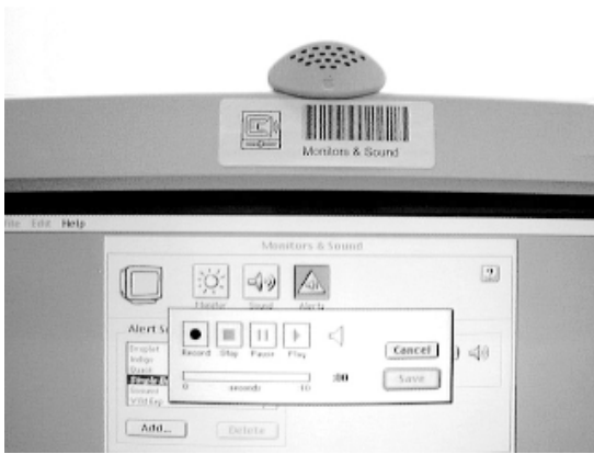
(c) ディスプレイなど周辺機器に貼って、制御パネルプログラムを起動する