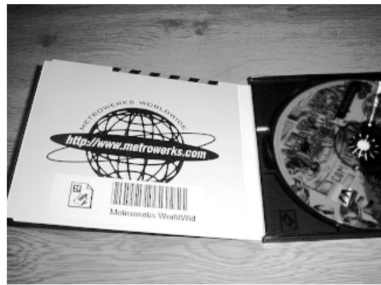
(d) 製造会社 WWW ページの URL アイコンを貼って、製品情報ページを開く