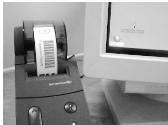
図5. IconSticker は、ディスプレイ脇に置かれたラベルプリンタで印刷される。

試作システムは、ドラッグ&ドロップされたアイコンのエイリアスを実際に内部で作成して、これを特定のディレクトリーに格納している。エイリアスの名前には、作成されたタイムスタンプを使用して識別している。タイムスタンプは、Mac OSが用意している1秒単位の32bit タイムスタンプで、これを16進数表記した、8文字の英数字がエイリアスの名前になる。印刷を含む IconSticker の作成には1秒以上の処理時間を要するので、特別な遅