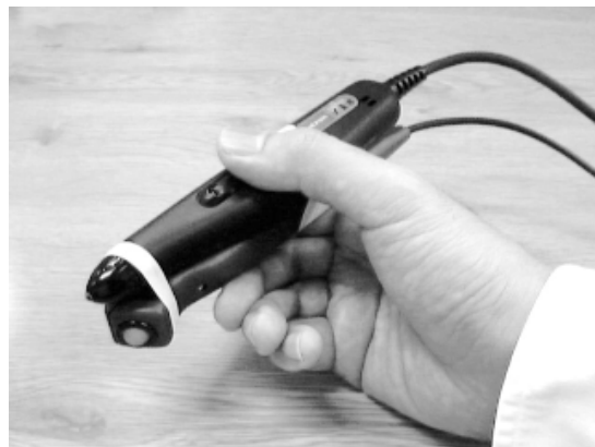
図7. 試作機では、バーコードリーダーとメカニカルマウスが組み合わされたペン型デバイスを用いた。

まず、複数のコンピュータでIconStickerの情報を共有するため、エイリアスを格納するための専用のファイルサーバを用意した。次に先のプログラムで、エイリアスの格納場所をローカルなファイルシステムとしていた部分を、ファイルサーバに変更した。Mac OSのエイリアスは、ネットワーク上のマシン名情報を保持している。こ