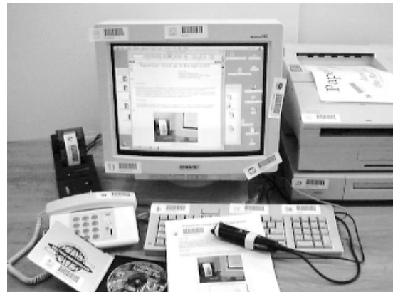
図3. IconSticker を使って画面の外にもアイコンを並べた様子。

画面の中のアイコンを IconSticker として印刷することで、アイコンを画面の外に取り出し、実世界に配置する