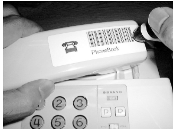
(b) 電話機に貼って、電話番号データベースを開く