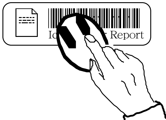
図6. IconStickerのバーコード部分を読み取ると、元のアイコンがコンピュータディスプレイ内で開く。