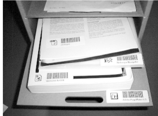
図10. パイルキャビネットから書類を引き出したところ。IconStickerにより、ソフトコピー、コンピュータアプリケーションなども収納でき、電子的な作業環境も切り替えることができる。

IconStickerは紙であるので、書類と同じ道具を利用することができ、ファイルキャビネットにも、パイルキャビネットにも格納することができる。大量の電子的な情