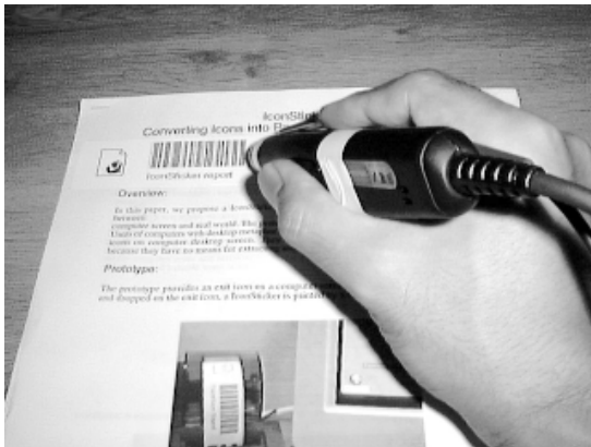
(a) 印刷結果に貼って、オリジナルのファイルを開く