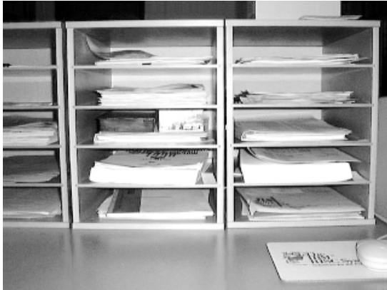
図9. パイルキャビネットの例。進行中の仕事の書類やフォルダーを重ねて棚に収納する。素早いアクセスが可能なので、仕事の切り替えが円滑になる。

コンの配置へと拡張するものである。さらに、既存の文房具や家具、掲示板といった紙の文書を存するのに役立つ道具を、アイコンの整理そのものにも使うことができるようになるというメリットをもたらす。アイコンを紙として出力したならば、それらの情報はまさに紙の情報として、ペーパーホルダー、引き出し、書類入れなどを利用して管理することができるようになる。