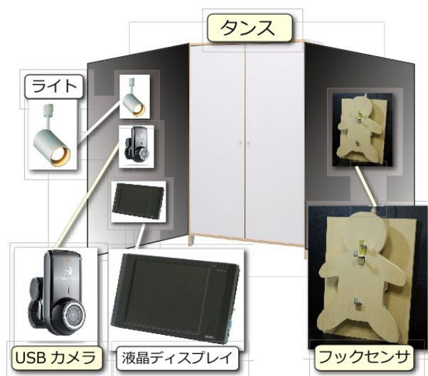
図 1: タグタンスの基本コンセプト. タンスの両扉の内側を使い, 片側に USB カメラ, 照明, 液晶ディスプレイを, もう片側にはフックセンサを設置する. フックに重さがかかるとフックの下に装着された圧力センサが反応し, 撮影が行われる.

そこで, 本研究では, ユーザがフックに洋服を掛けるだけで, 手軽に洋服を撮影/デジタル化して, Web 上にアップロードすることができるシステム「タグタンス」を提案する.