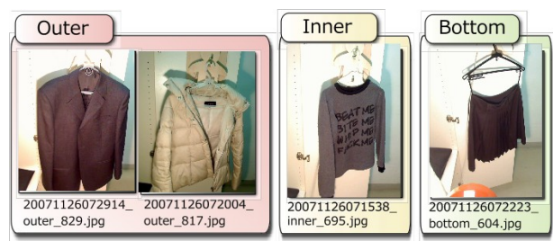
図 3: タグタンスの撮影例。アウター / インナー / ボトムと大まかな重量が自動的に判定される。