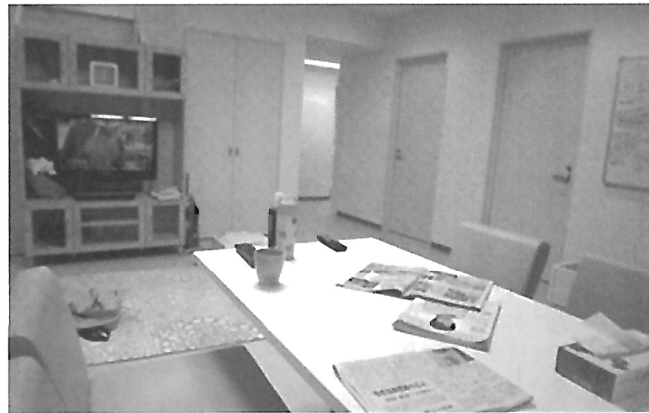
お茶大SCC ハウス内のリビング(共用スペース)