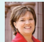
リン・パスクェラ氏 Lynn PASQUERELLA

米国 (USA) マウント・ホリヨーク大学 Mount Holyoke College