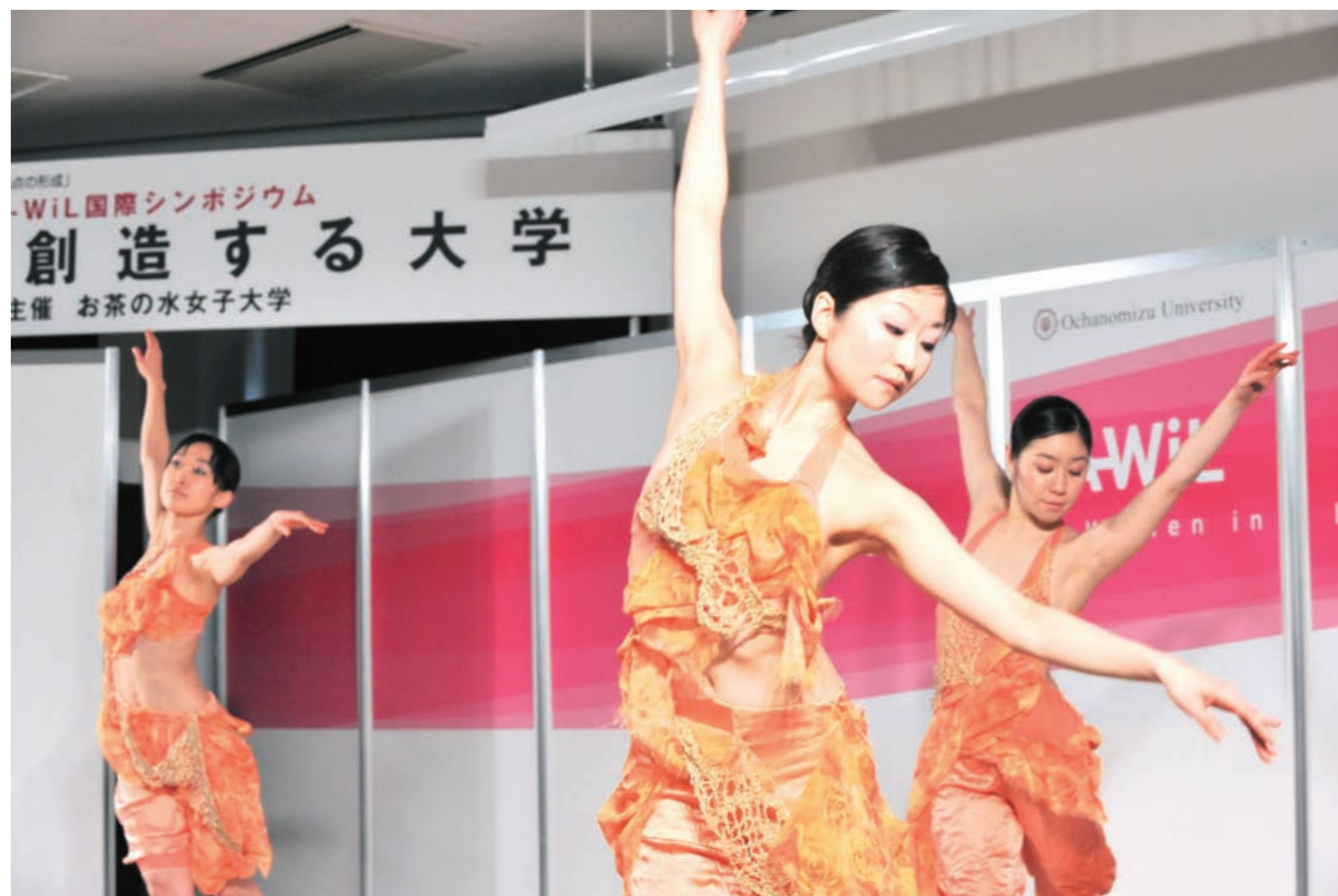
卒業生による「飛天」

飛天プロジェクトは、JAXA（宇宙航空研究開発機構）の文化・人文社会科学利用パイロットミッションの一環として、本学名誉教授である石黒節子氏の発案により H21 年に国際宇宙ステーションにて実施されました。敦煌の壁画や仏教絵画で描かれる「飛天」をヒントに、無重力空間における人の動きや姿勢の新たな美しさを引き出し、舞踊表現として細部にまで工夫を凝らし、無重力ならではの浮遊環境を生かして、「飛天」の姿・形をイメージした動きを実施し、地球上の平和を願うメッセージとしました。