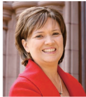
リン・パスケレラ氏 米国・マウント・ホリヨーク 大学学長