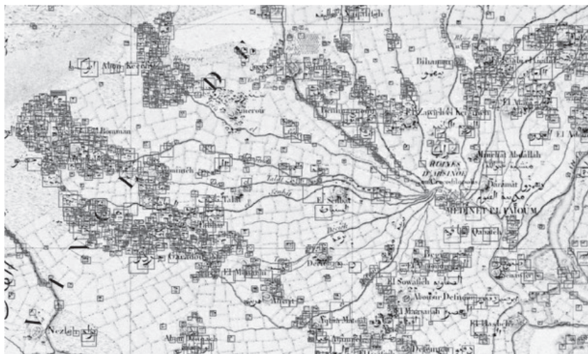
【図1】 ナポレオン地図におけるヤシの木の分布（機械学習を応用してナツメヤシの記号を識別するプログラミングによる結果。ヤシの木のマークは、カラーの四角で囲まれている。©小澤泰生）

までのところ判断がつかない 19 。そこでまずは、ナツメヤシの分布と地理的条件の関係性について検討することとし、デジタル標高モデル (DEM) を用いて標高地形図を作成することとした。もちろん、中世のファイユームの標高データを得ることは不可能であるので、近代以降のデータに依拠することになる。得られる最も古い標高データは一九〇八—一九一〇年に測量されたものである。他方、最新のデータに基づく標高地形図を作成する。基本となるデータは JAXA が提供する三〇メートルメッシュの標高データセットであり、GIS アプリケーションを用いて標高値別に色分けをする 20 。