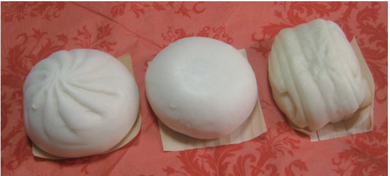
図5.3 左から肉包子、豆沙包子、花卷（饅頭）