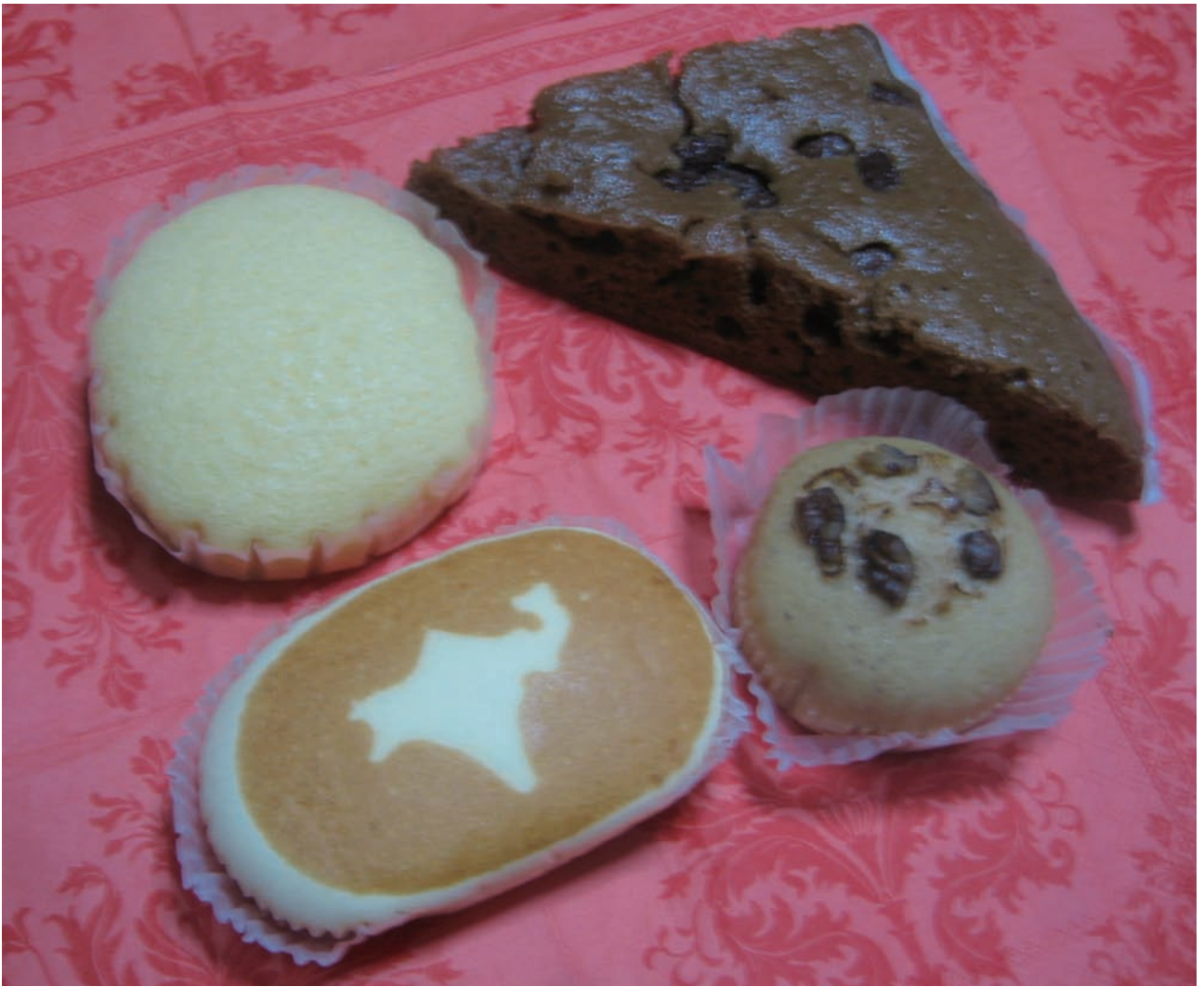
図5.1 蒸しケーキと蒸しパン