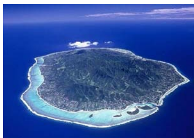
クック諸島ラロトンガ島