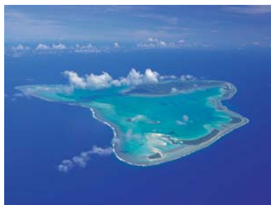
クック諸島アイツタキ島