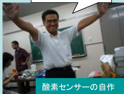
実験が成功し 喜ぶ受講教員