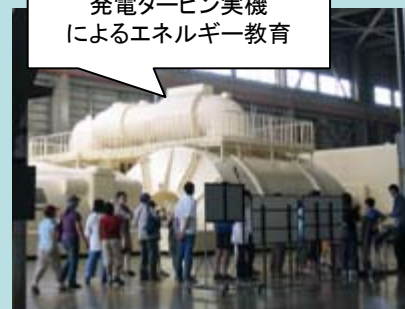
発電タービン実機 によるエネルギー教育