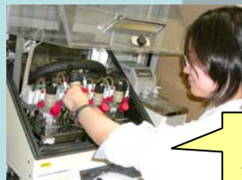
先端技術・製品の 評価受託します。