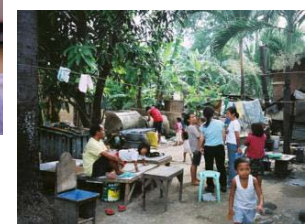
この他 国内外の子育て・地 域・教育・のニーズに応じたア ジアの子育て支援