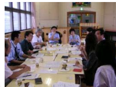
教員向けケースカ ンファレンスや 個別対応のコンサル テーション