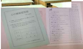
心の健康調査質問票