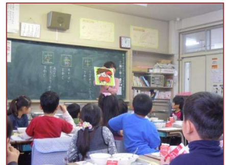
小学校における行動科学を用いた紙芝居による食育