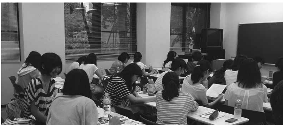
対話（事実質問）の練習風景