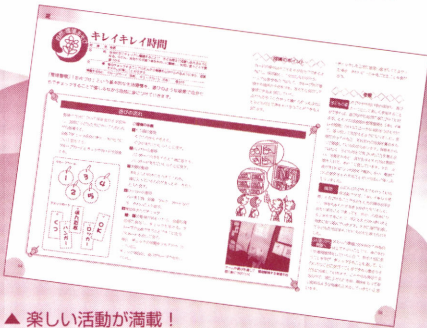
▲楽しい活動が満載！