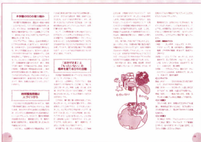
▲10年来の環境教育実践をまとめた入門書