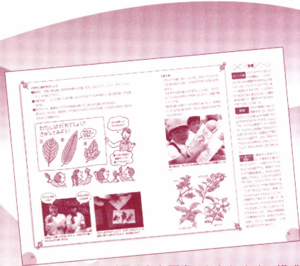
▲イラストと写真でわかりやすい構成