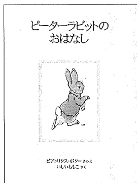
▲『ピーターラビットのおはなし』 ビアトリクス・ボター作・絵 いしいもこ訳、福音館書店 (福音館書店からシリーズで刊行)

もちろん絵や言葉や話の展開だけが絵本を作り出しているわけではない。『ぐりとぐら』の絵本が、野ネズミの背丈に合わせた天地の低い横長の版型であるからこそ、画面の端から端まで居並ぶ動物たちを描くこともできるのだ。『ピーターラビットの絵本』は、小動物が織り成すファンタジーをのぞき込むかのように、手のひらに乗る小ささでなくてはならないし、『三びきのやぎのらがらどん』は見開きいっばいに大ヤギがはみでるような大きさでなくてはならない。版型が統一