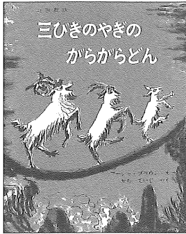
▲『三ひきのやぎのからがらどん』 (ノルウェーの昔話) マーシャ・ブラウン絵 せたていじ訳、福音館書店

作り手の心の中に居る〈子ども〉と、その欲するところを形にしようとする作り手、目の前の子どもに寄り添って共に「描かれた世界」を旅しようとする大人と、「描かれたもう一つの世界」に入り込んでいこうと目を輝かせている子ども、それらが作りなす〈場〉こそ、「絵本の世界」といい得るのではないだろうか。そこで得た体験が、将来の読書習慣につながることもあるかもしれない。