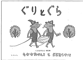
▲『ぐりとぐら』 中川李枝子／文 大村百合子／絵、 福音館書店

物たちは不自然な動きをしている。遠近法が使われていないせいも、野ネズミたちが木よりも大きく見える場面もあれば、卵の大きさも場面によってまちまちである。オオカミもシカも、ワニもゾウも、カニやトカゲやカタツムリまで、みんな集まってくる森などあるはずもない。おまけにくら大きいとはいえ、カステラがすべての動物にたっぷりあてがわれ、まだ残っているなど、現実には考えられない。