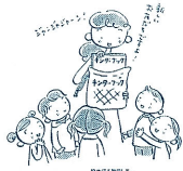
100頁 じっくりと楽しむ読み

原簿様式をクラスの色紙に引かれて、子どもたちが自分たちで作った絵本を、保育現場で活用できるようにするためのヒントを伝えます。また、保育現場での実践例も紹介します。